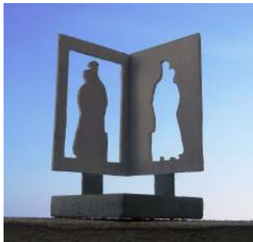
Escultura de Andrés Montesanto

La escultura está compuesta por la silueta de una persona (el emigrante), de color oscuro, que se recorta sobre un vacío formado por las siluetas de otras personas en un recuadro blanco (su familia, sus amigos).