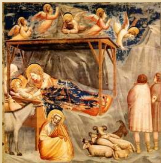
Natività di Giotto - Padova